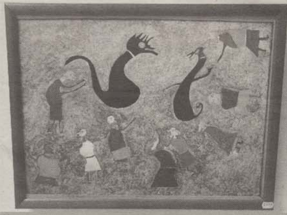
Ilija Bosilj, „Nojeva barka“