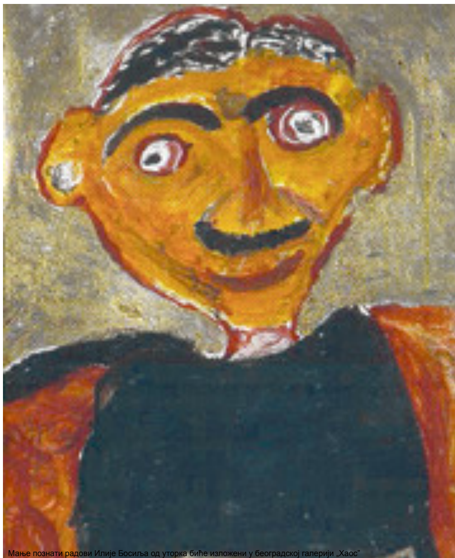
Maње poznati radovi Ilije Bosilja od utorka biće izloženi u beogradskoj galeriji „Хаос“

Autor: Borka Božović | petak, 08.01.2010. u 22:00