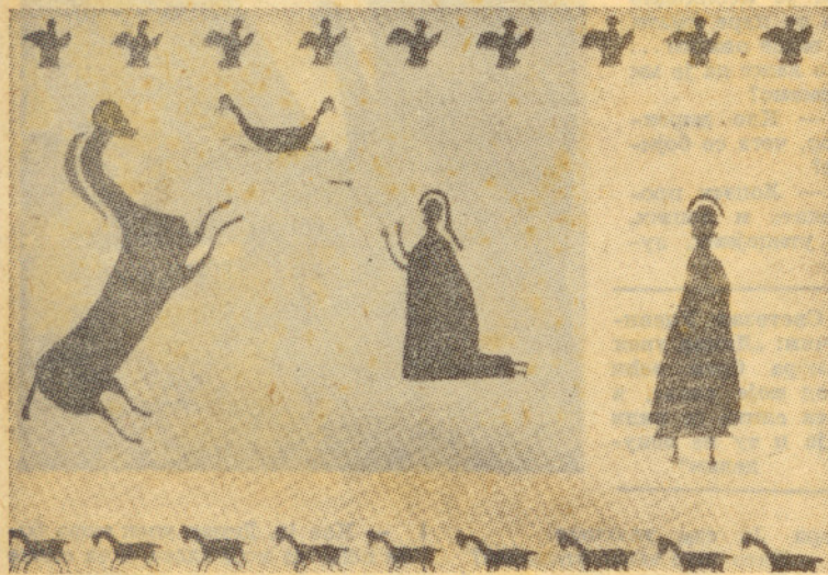
Фигуративно приказана Смрт мајке Југовића